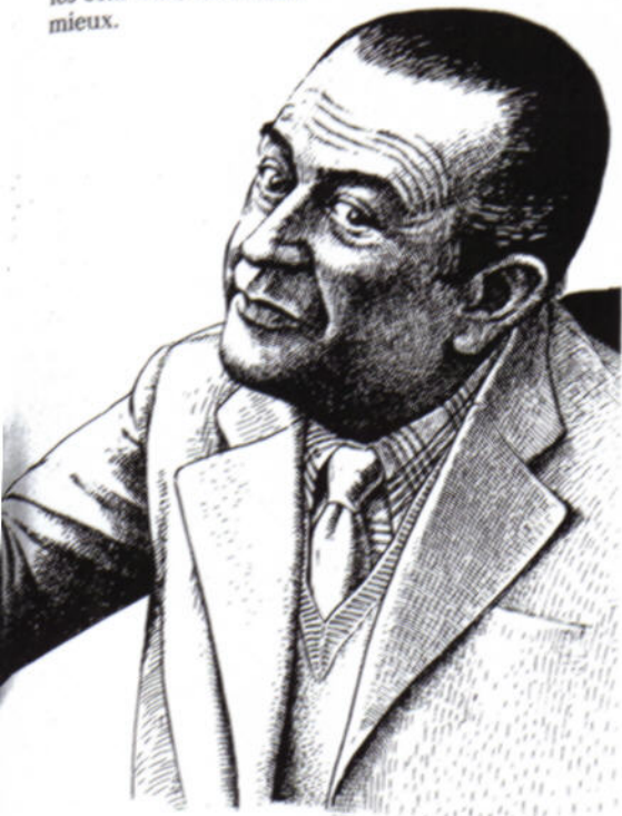
Dessins Cl. Lacroix

gie et l'argent des usagers à bâtir des lignes à haute tension alors qu'un ingénieur a réussi à mettre le courant en bouteilles, nous recevrons immédiatement un rectificatif à publier nous expliquant, soit que le procédé est connu mais inapplicable, soit qu'il est valable mais trop cher, soit encore qu'il s'agit d'une pure affabulation. Il en irait évidemment de même si nous écrivions que les laboratoires pharmaceutiques se payent la tête des gens puisque l'eau de mer guérit tout, ou qu'il est dérisoire de construire des voitures à 4 roues alors qu'avec deux chenilles cela irait tellement mieux.